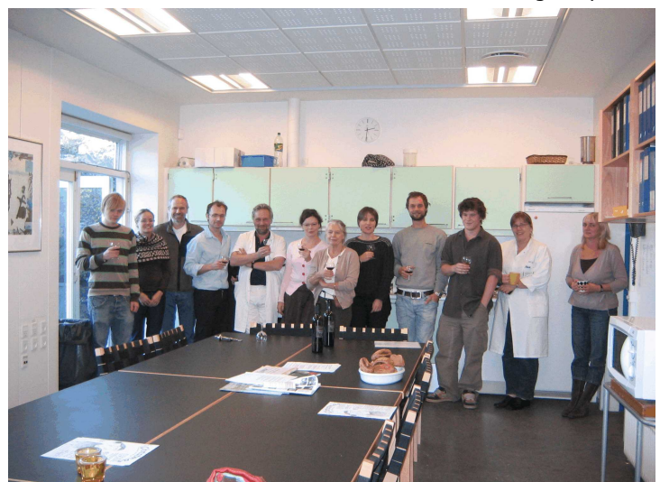
Parker Institute staff at Frederiksberg Hospital